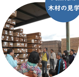
天然乾燥 木材の見学