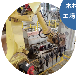
木材加工 工場の見学

広大なストックヤードに、豊富な木材のストック！「てまひま」かけた木材生産の過程をお話しします。